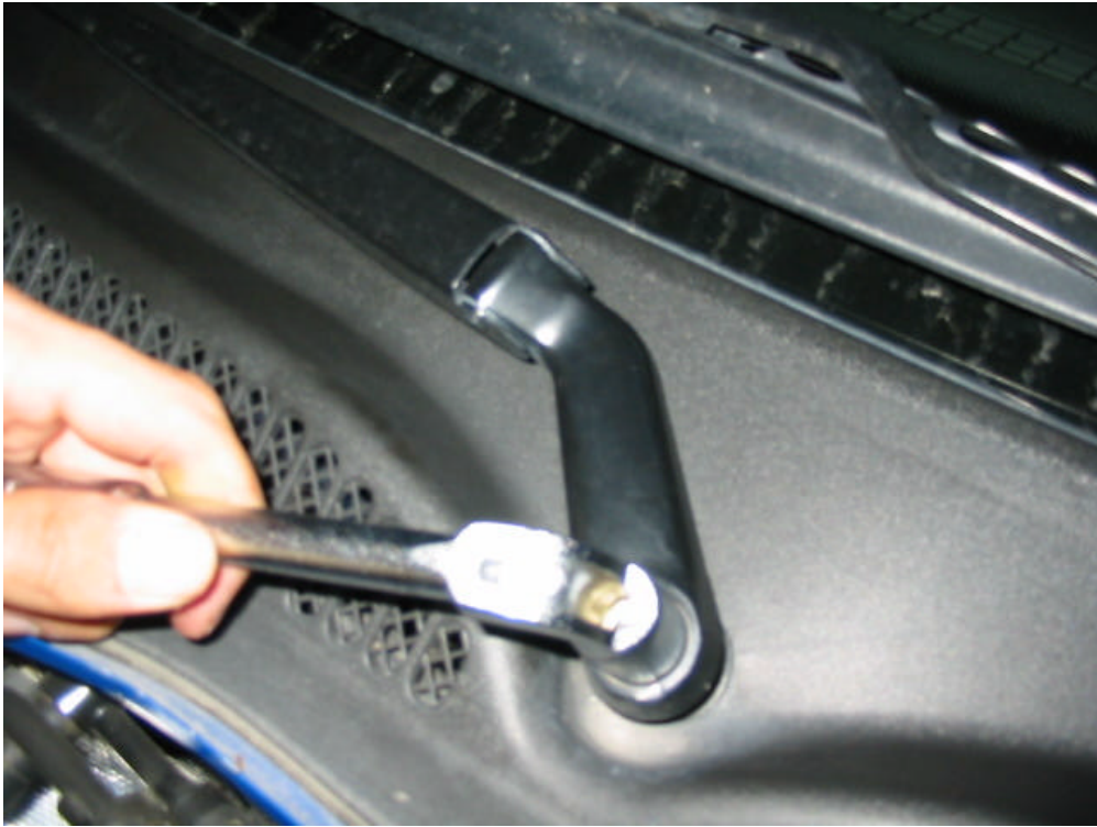
Dévisser les écrous des balais d'essuie-glace